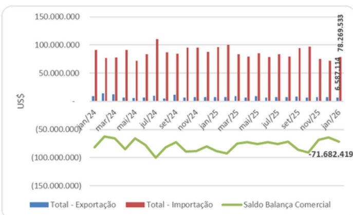
Gráfico 1 - Balança comercial de lácteos (US$)